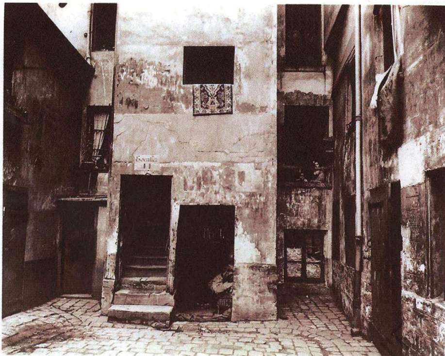
Fig. 1. / Eugène ATGET, Rue Broca , 1912, extrait de la série Topographie , Paris 1906–1915.